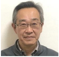
サービス管理責任者