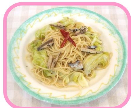
〈春キャベツとオイルサーディンの