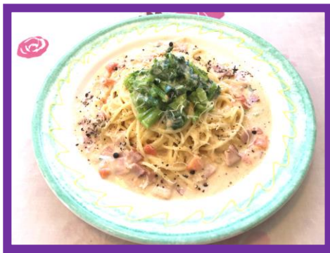
〈菜の花とベーコンのクリームパスタ〉