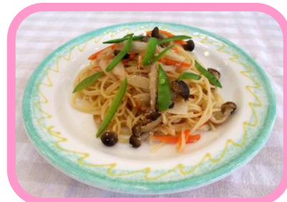
たらこ野菜のパスタ ¥500