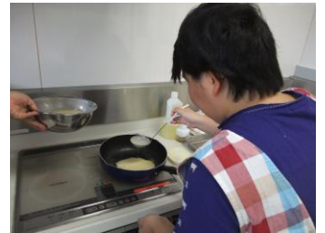
レスパイト事業 管理者：岡部雅彦

8月31日に桜井福祉センターの調理実習室にてクレープ作りを行いました。具材を切る、クレープの生地を焼く、皆さんとても上手に焼けていましたよ♪それぞれの工程をみんなで協力し合い、助け合いながら作っていました。クレープ生地に自分の好きな具材を好きな様に乗せ、それぞれの個性がでていて皆さんとても美味しそうに食べていました。