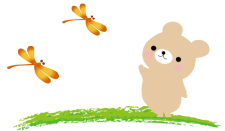
生活介護事業所 こだわりの店 ロゼ 管理者：岡本 摩奈美