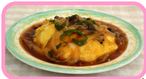
きのこの 和風あんかけパスタ ¥600