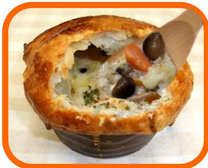
ホットパイ in きのこクリーム ¥500