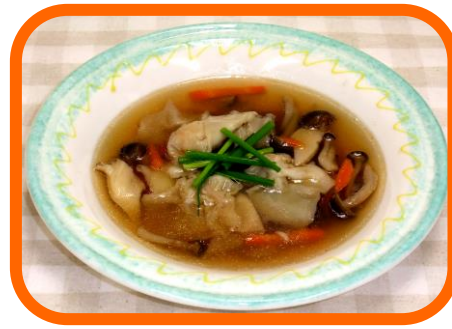
えびワンタンスープ ¥500