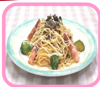
〈高菜のたらマヨパスタ 芽キャベツ添え〉 ¥ 700