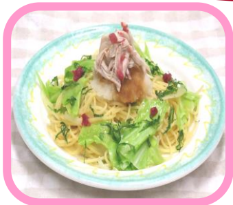
〈鶏と梅のおろしパスタ 青じそ添え〉 ¥ 500