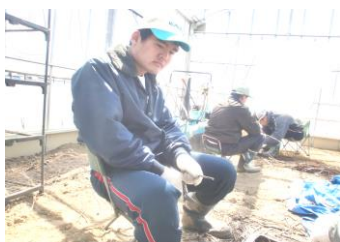
(枝や幹をハウス内で切っています)