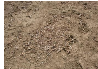
(切った枝や幹は畑に撒きました)