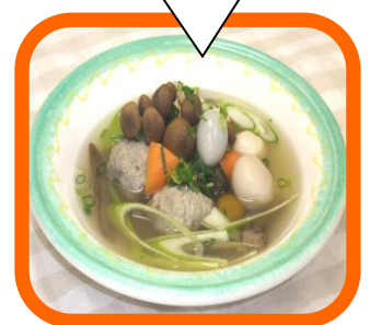
〈和風肉だんごの 野菜スープ〉 ¥ 500