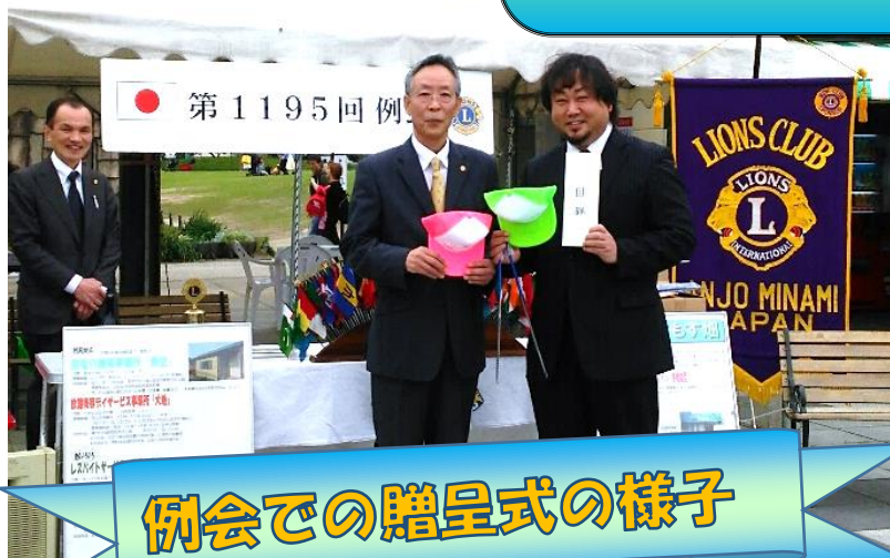
例会での贈呈式の様子