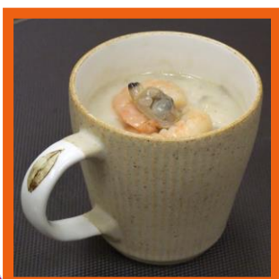
〈根菜のクラムチャウダー〉 ¥500