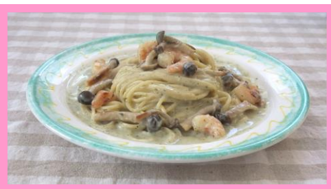
〈エビとしめじのホワイトバジルパスタ〉 ¥850