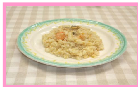
〈シーフードチーズリゾット〉 ¥500