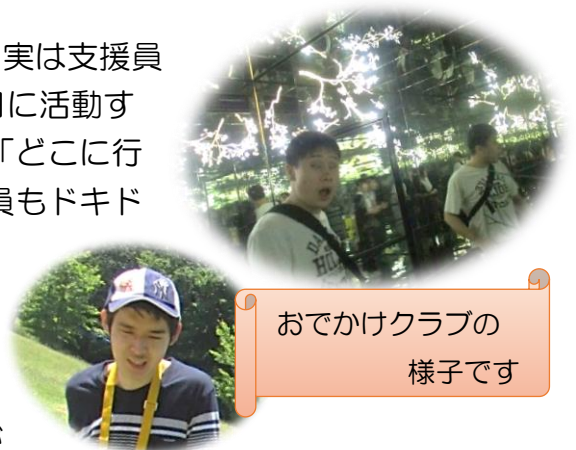
おでかけクラブの様子です

私たち支援員は、クラブ活動を利用者様と一緒に楽しむことで、マイスペース内での作業や余暇活動とはまた違った利用者様の姿を発見、そしてその発見を日々の支援に生かさせていただいています。